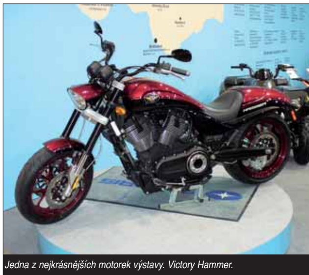
Jedna z nejkrásnějších motorek výstavy. Victory Hammer.

Průznivci endur nemohli minout stánek BMW s novým modelem F800 GS. Je poněkud drsnějšího řazení, takže vyloženě