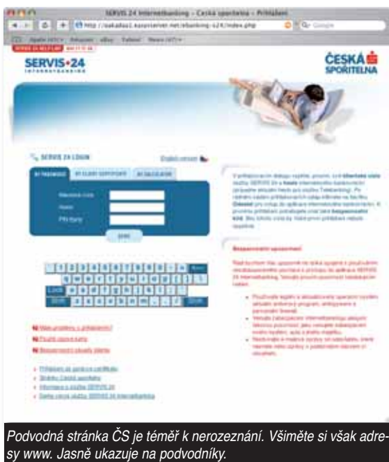
Podvodná stránka ČS je téměř k nerozeznání. Všimněte si však adresy www. Jasně ukazuje na podvodníky.

Obrana je jednoduchá. Žádná banka neposílá máily, kde by vyzývala k zadání přístupových kódů rovnou s prolinkem. Navíc, pokud na podvodné stránce kliknete na jakýkoliv odkaz, je nefunkční.