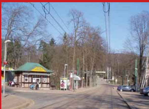
Pohled dnešní ...