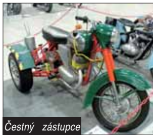
Čestný zástupce tříkolek na výstavě Bohemia Custom.

Ale ani letos se nenechala například zahanbit Yuki, nabízející maloobjemové stroje. Nevím jak s kvalitou, ale ceny byly velmi příjemné a design je každý rok lepší.