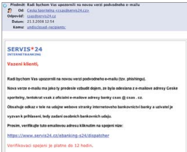
Falešné mailů, tzv. phishing. Od těch pravých vypadají lecky k nerozeznání. Banky však výzvy k zadání údajů nikdy neposílají.

Liberečáky můžeme uklidnit, poškození klienti jsou ze severní Moravy, všichni ve věku kolem třiceti let. Zkoušeli jsme se na telefony v seznamu dovolat. Žena ze severní Moravy skutečně existovala a všechny údaje seděly. O podvrh tedy nejde.