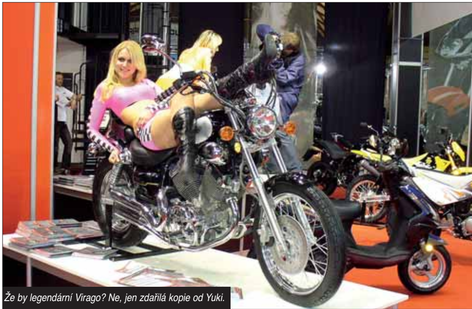
Že by legendární Virago? Ne, jen zdražilá kopie od Yuki.

Ve velkém stylu se zde prezentovaly všechny významné značky na již tradičních místech výstaviště. U renomovaných výrobců je předpoklad, že si největší tuzemské motovýstavy považují a předvedou se v co nejlepším světle.