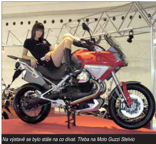
Na výstavě se bylo stále na co dívat. Třeba na Moto Guzzi Stelvio

Velmi zajímavými stroji se prezentovala italská Aprilia, například modelem Shiver 750. Dal-