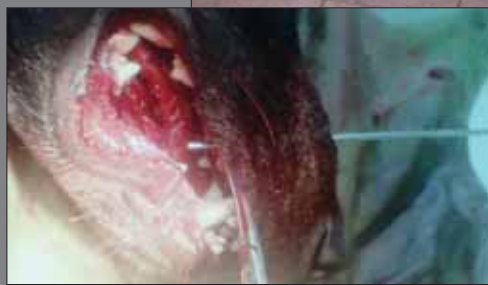
Fotografie z operace. Pes měl prostřelené patro, roztržené zuby a další zranění. Operace trvala téměř pět hodin.

ny zhojily do té míry, aby se mohl postavit k míse. Báť jsem se komplikací. Střela poškodila nerv a hrozilo ochrnutí,“ popisuje.