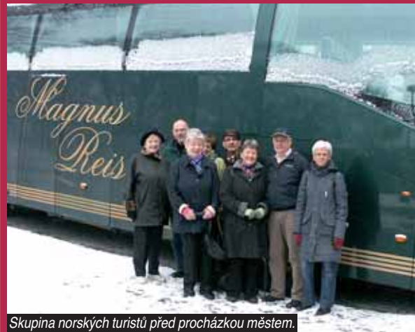
Skupina norských turistů před procházkou městem.

se nám líbí město, není tady tolik lidí jako třeba v Paříži nebo v Praze. Naši klienti u vás oceňují genius loci Liberce a rádi nakupují sklo."