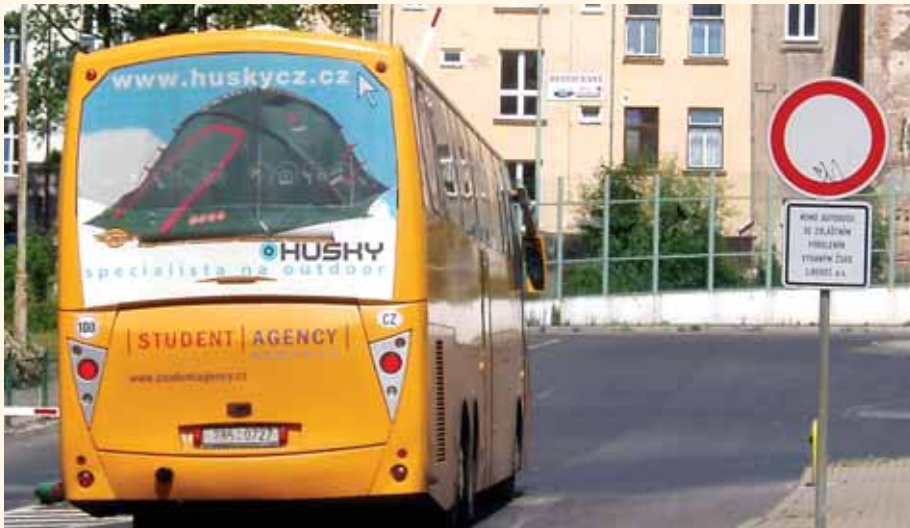
Zákaz vjezdu pro Student Agency se ČSAD Liberec nevyplatilo. Příchod konkurence s luxusními službami a minimální cenou bylo však pro libereckého přepravce fatální. Udržel Student Agency nasazenou laťku?