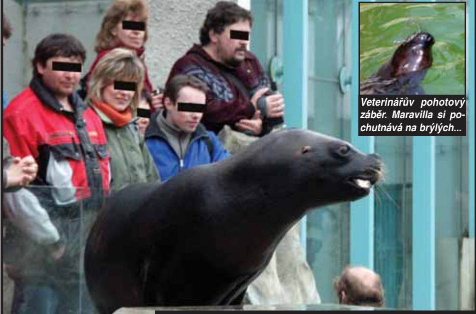
Veterinářův pohotovostní záběh. Maravilla si pochutnává na brýlích...