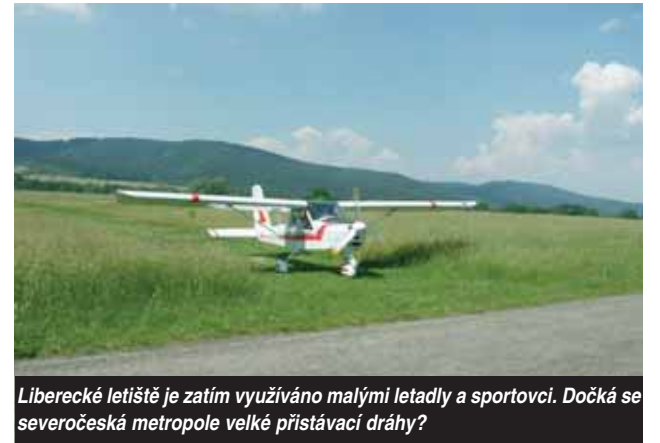
Liberecké letiště je zatím využíváno malými letadly a sportovci. Dočká se severočeská metropole velké přistávací dráhy?

Nedávno se dokonce objevily plány na využití pozemků na letišti pro výstavbu velkého sídliště. Stojí za nimi silná liberecká stavební lobby. V okolí Liberce přitom chybí velká plocha, jež by se v budoucnu dala využít pro jiné