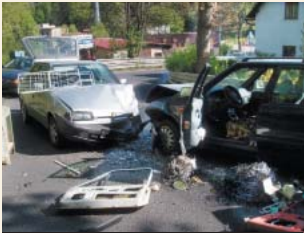
Řidič modré felicie, shodou okolností z Ruprechtic, vezl šrot. A tak po střetu na voze viníka nehody přistály dveře od staré škodovky a vysloužilý sušák na prádlo. Oba vozy měly hnutou karoserii, tudíž budou pravděpodobně odepsány.

„Po této silnici jel Kateřinskou ulicí směrem na Ruprechtické náměstí řidič s felicií. Při vyjíždění z levotočivé zatáčky přešel částečně do protisměru, kde se čelně srazil rovně s řidičem felicie, který měl za vozem přívěs. Při nehodě se